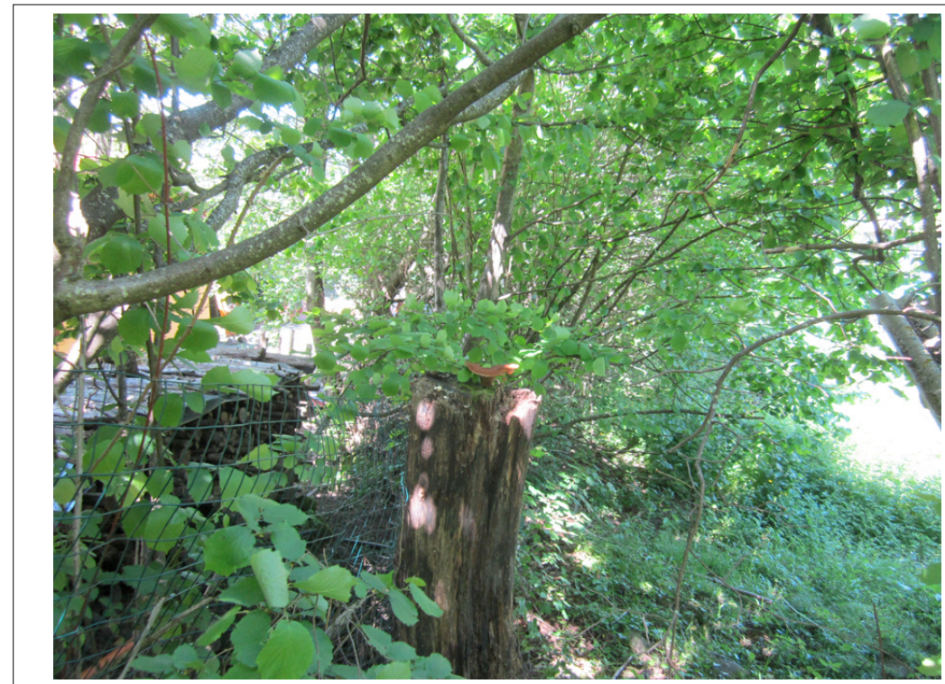
9 La Gora