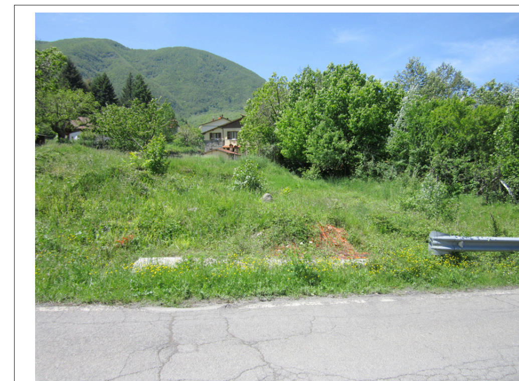
8 Veduta da via del Falterona