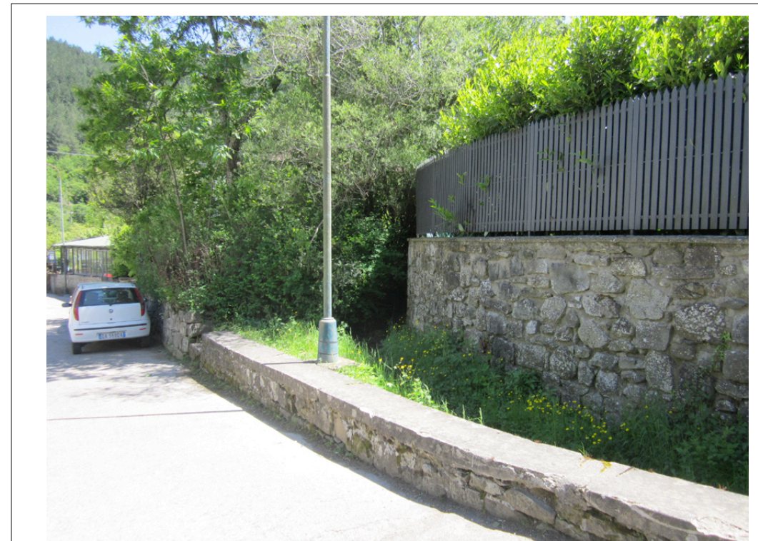
10 Veduta della gora da via del borgo