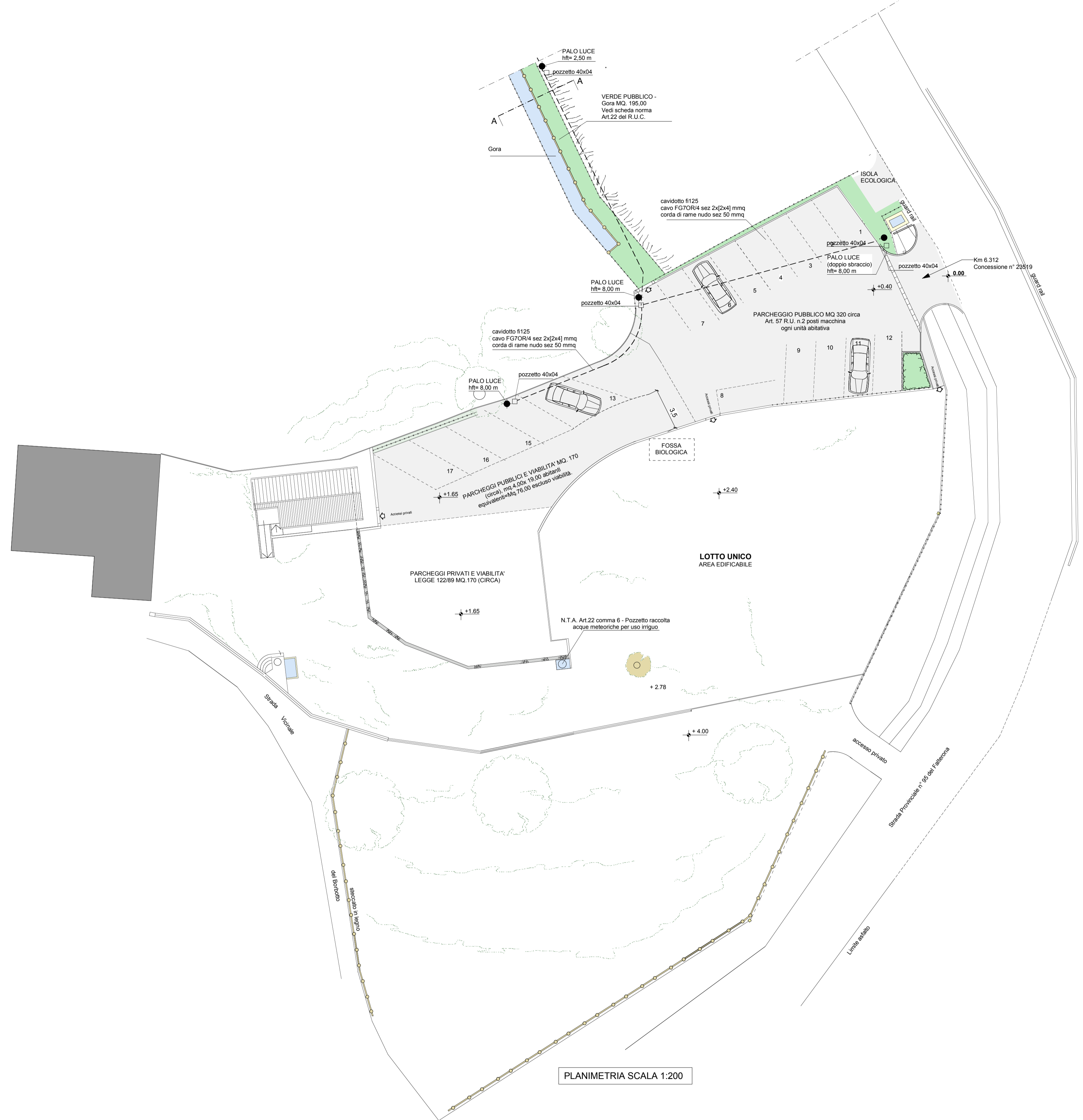
PLANIMETRIA SCALA 1:200